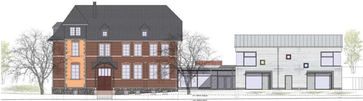
Abb. 2: Entwurfsansicht Süd-West, ohne Maßstab

„Lediglich die Anzahl der Vollgeschosse bleibt gleich, um das Gesamtbild gegenüber der Nachbarschaft zu bewahren. Auch die Angaben zur Stellung der Hauptgebäude sorgen für die Bewahrung des Gesamtbildes. Die Firstrichtung wird parallel zur Mittelstraße festgesetzt.“